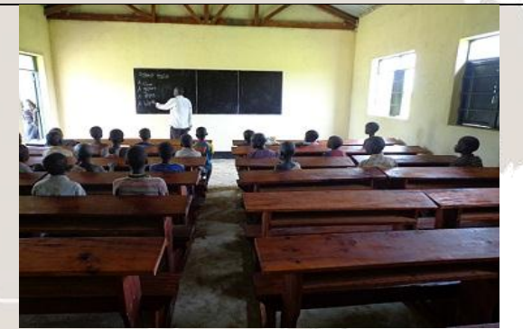
새로운 교실에서 공부하고 있는 아이들