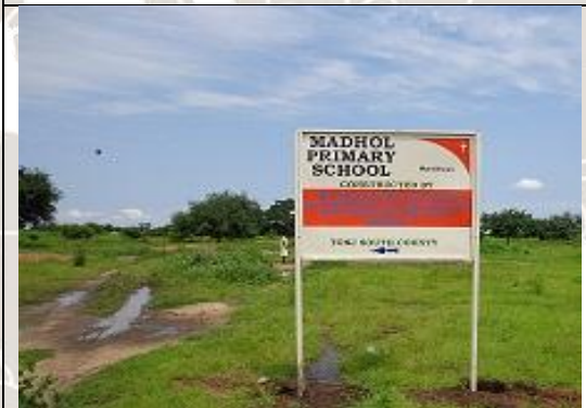
학교 임시 현판