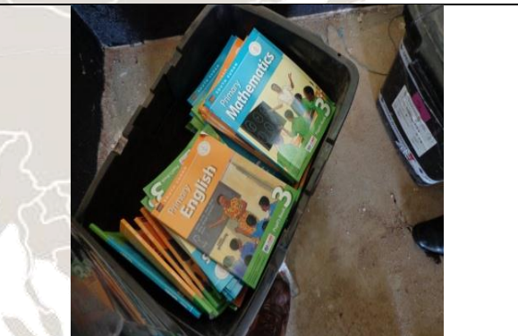
지역정부 교육부서에서 제공한 교과서