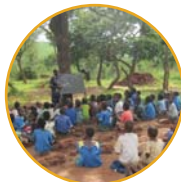
학교 건축 전 나무아래에서 수업 받던 학생들