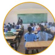
완공된 교실에서 수업 받는 학생들