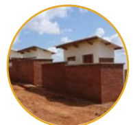
위생적인 화장실 완공